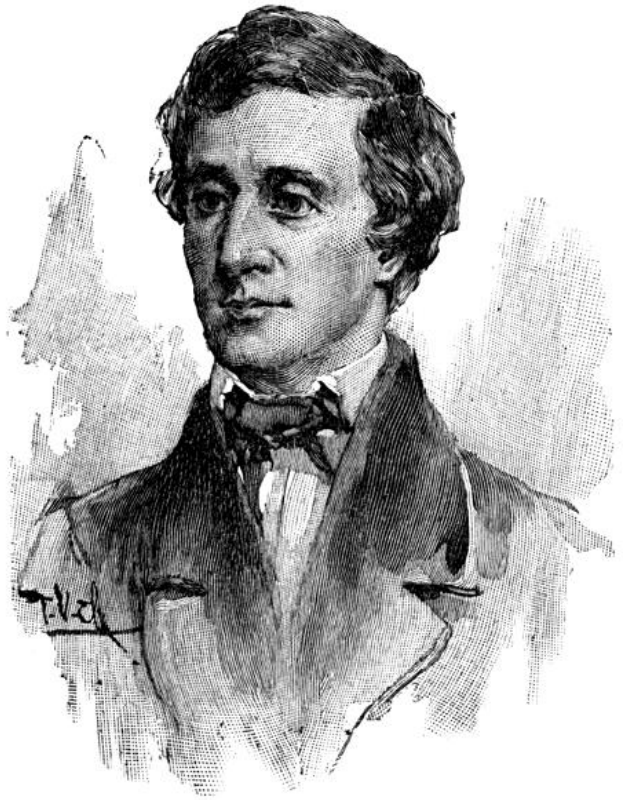
Henry David Thoreau