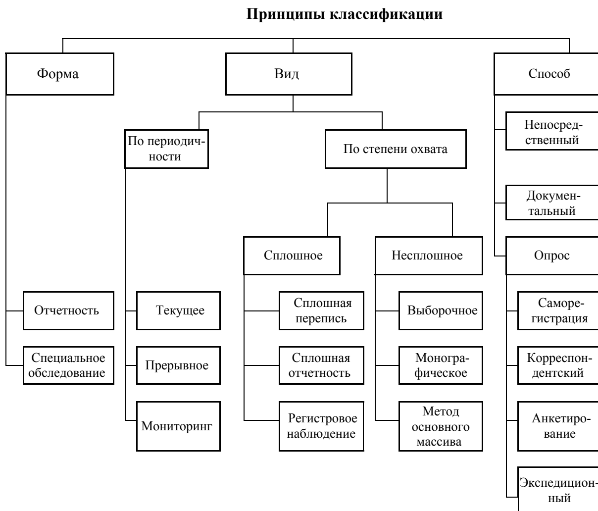
Рис. 1. Классификация статистического наблюдения

При разработке программы статистического наблюдения особое внимание следует уделить выбору формы, вида и способа наблюдения (рис.1.).