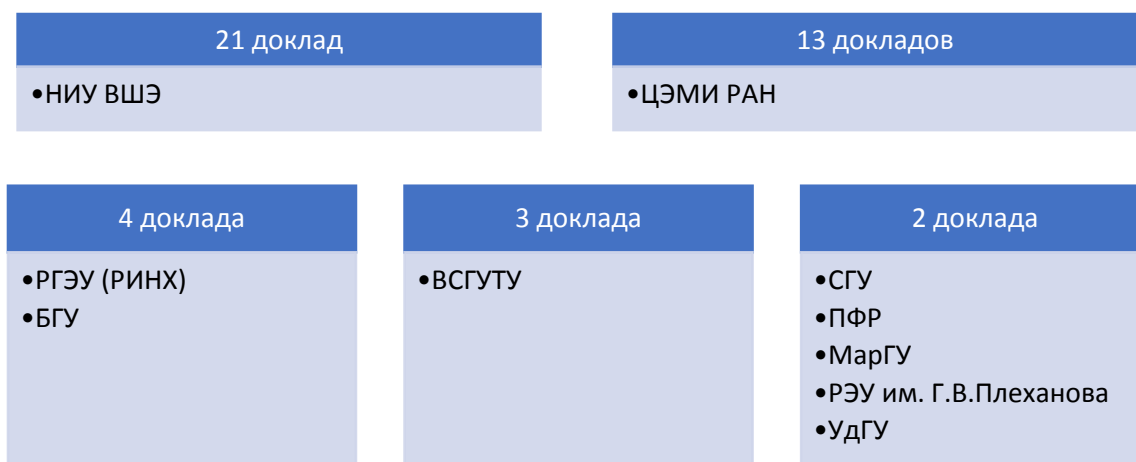
Рис. 4. ВУЗы, представившие 2 и более докладов