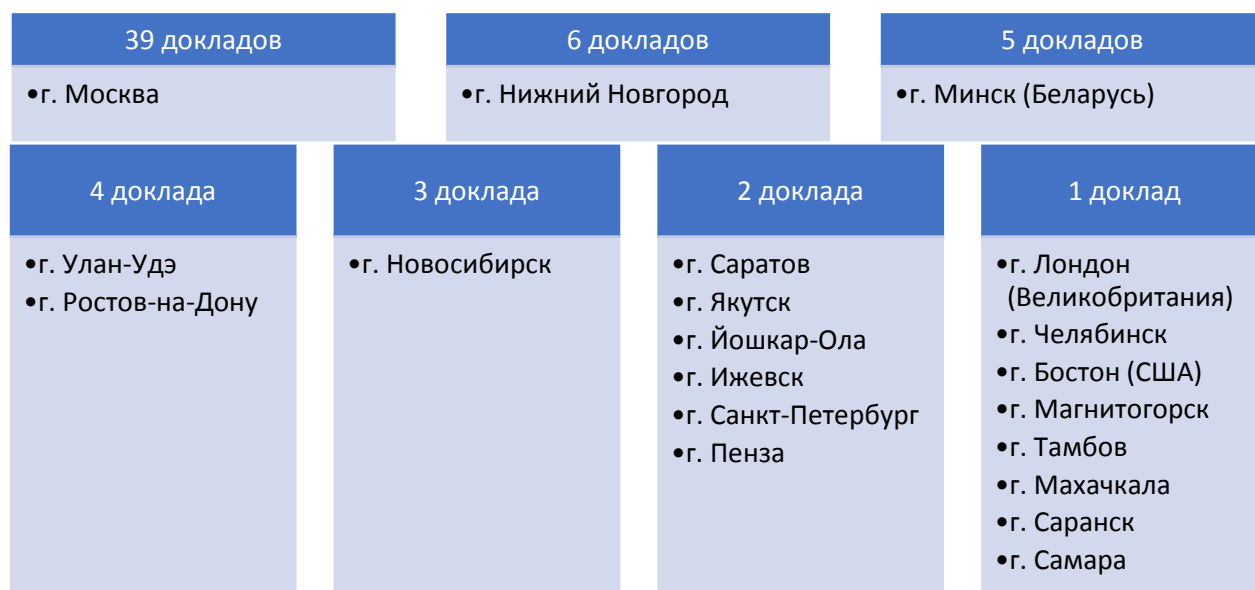
Рис. 2. География по городам